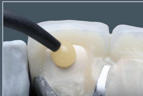
En palatin/lingual pour une liberté de sculpture