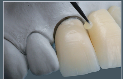
En proximal et cervical pour les compléments