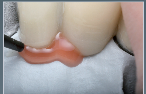
...und rot-weiß Ästhetik